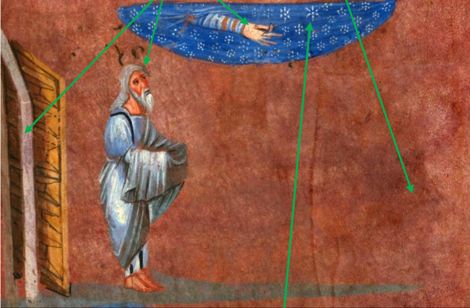
Wiener Genesis, manuscript from the 6th century, Österreichische Nationalbibliothek

Rab Avram'a şöyle dedi: ' Ülkenden ve evinden çık. Akrabalarını ve babanın evini sana göstereceğim ülkeye götüreceksin. Sizi büyük bir ulus yapacağım, sizi kutsayacak ve adınızı yücelteceğim. Seni kutsayanları kutsayacağım [...] ve yeryüzünün bütün aileleri senin içinde olacak.